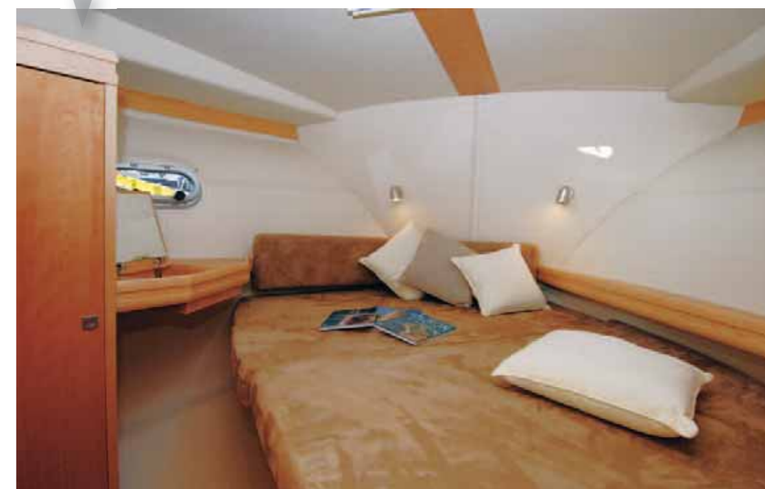
Cabine latérale. Side cabin. Cabina lateral.

Un confort maximal pour une nuit à bord. Maximum comfort for a night on board. Un confort máximo para una noche a bordo.