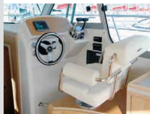
Une timonerie très spacieuse. Very spacious wheelhouse. Una timonería muy amplia.