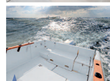
Un cockpit dégagé. Flat cockpit for fishing. Una bañera amplia.