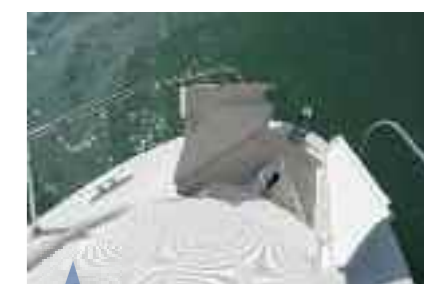
Une baille à mouillage conséquente. Deep anchor locker. Un pozo de ancla importante.